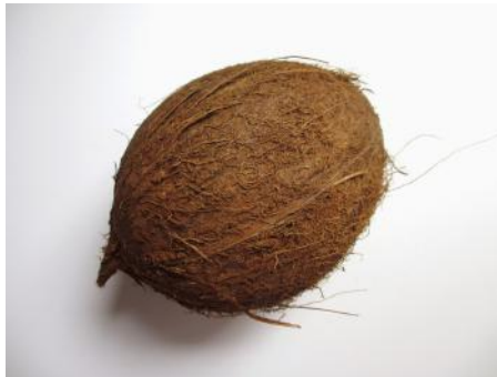
noix de coco